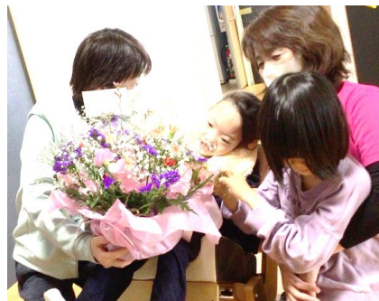
洛陽保育園さんからのお花を 受け取る子どもたち