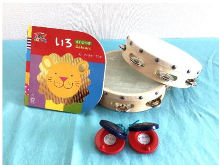
卒園記念品の 絵本・タンバリン・カスタネット

祝う会は、卒園児さんへのインタビューから始まり、保護者の皆さんからはあいあい教室との出会いや一緒に悩んだり笑ったりした保護者同士のつながりの大切さなど、思い出いっぱいのメッセージをいただきました。子どもたちと一緒に過ごした日々やたくさんの笑顔が思い出されました。職員からは、思い出の写真や職員によるオリジナルイラストなどを貼った記念色紙を贈りました。イラストは触れるように立体コピーで作っています。卒園児保護者の皆さんからは、卒園記念品として“絵本”“タンバリン”などをいただきました。大切に使用させていただきます。また、長年交流保育を続けている洛陽保育園様よりすてきなお花をいただきました。皆さま、本当にありがとうございました。卒園するお友だちの、新たな一步を応援しています！