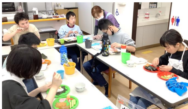
みんなで手巻き寿司パーティー♪

4月から新たな生活を送っている2人。今までの経験と自分自身に自信と誇りを持って、新たな出会いを楽しんでください！卒業生とその保護者の皆さんを変わらず「おかえり」と迎えらるあいあい教室でいられるよう、これからも歩んでいきます。