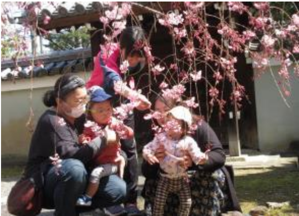
桜にそっと触れてみたよ

さて、5月からは外遊びが始まります。外は新たな発見であふれていますね。また、帽子をかぶる、外でお茶を飲む、斜面や草の上を歩くなどの経験も一緒にしていきましょう！