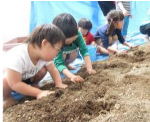
両手で砂を集めて、 お山を作ったよ！