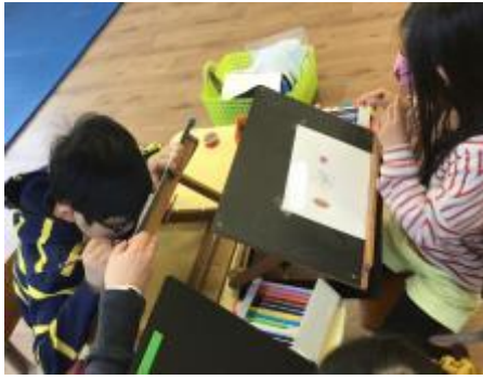
桜の花はどんな形かな？