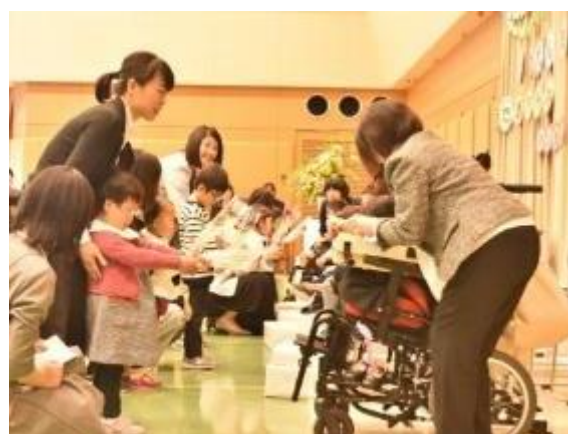
自信いっぱいインタビューに答える子どもたち 「おめでとう！」在園児さんからの花束贈呈