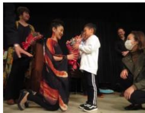
「フィドル」のみなさんの演奏