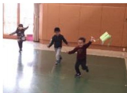
ホールで凧揚げ！ いっぱい走ったよ