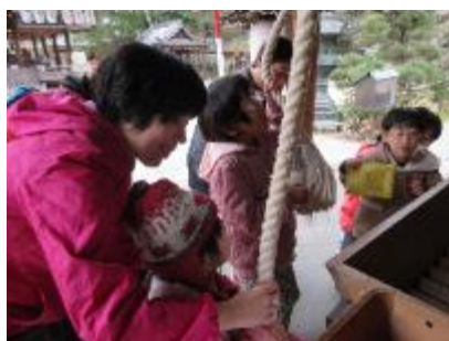
今宮神社へ初詣。 お願い事もしたよ