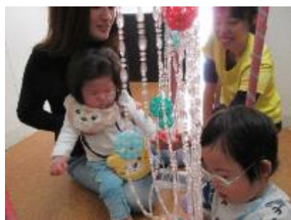
あいあい神社の 鳥居は毎年大人気！

また、製作の時間には画用紙で凧を作りました。最初に、扇風機で見本の凧に風を当てて、“凧が揚がる”とはどういうことなのか触りながら確認しました。そして、骨の役割をするストローや足になるセキスイテープ、凧系の先には厚紙の持ち手を付けたら完成です。セロハンテープを切る、持つ、貼るには指先の力を使います。テープが少しくシャットなっても「もう一回！」と自分で頑張る姿も見られました。完成したらホールで凧揚げです。凧系を持った手をしっかり拳げながら、みんなで思いっきり走って凧揚げを存分に楽しみました！