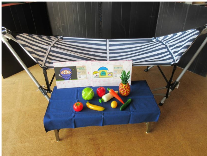
卒園記念品 “紙芝居” “ハンモック” “野菜と果物の模型セット”

卒園児保護者の皆さんからは、卒園記念品として“紙芝居”“ハンモック”“野菜と果物の模型セット”をいただきました。大切にに使わせていただきます。当日は、来賓として盲学校の先生や、併行通園先の先生方、また元職員の方々もお祝いに来て下さいました。また、毎月交流保育を続けている洛陽保育園様より、すてきなお花をいただきました。多くの方々と一緒に新たな旅立ちをお祝いすることができ、嬉しく思っています。皆さま、本当にありがとうございました。