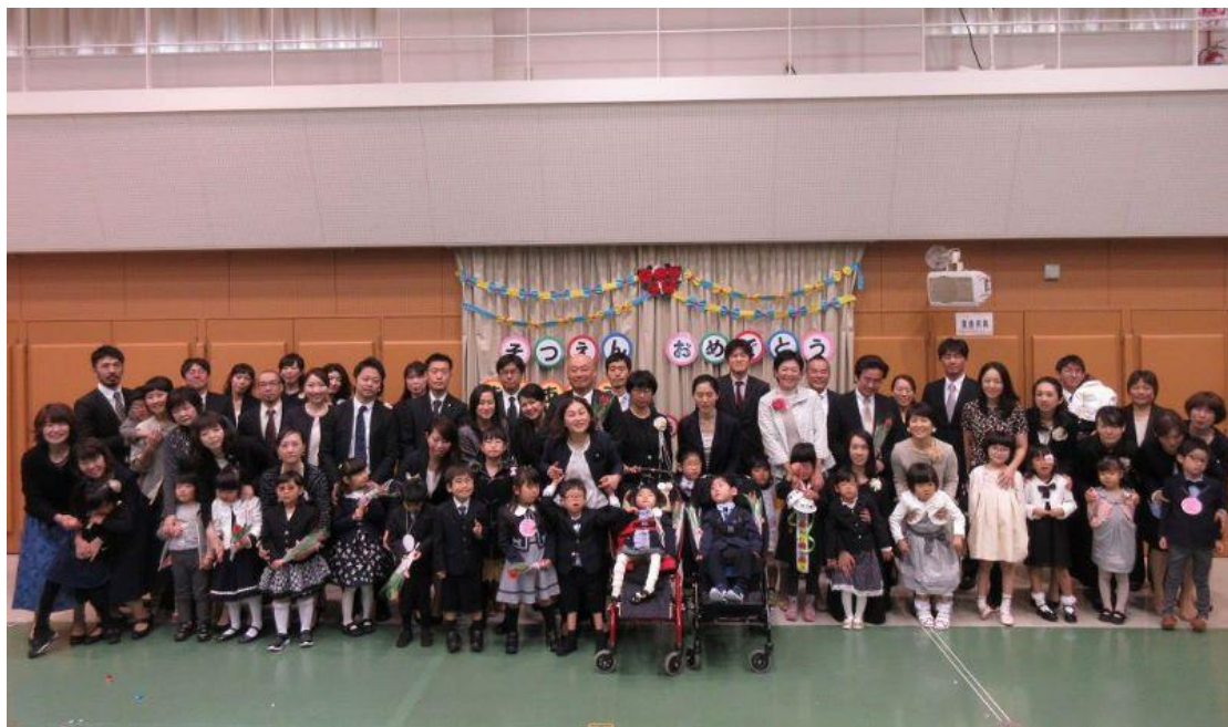
職員と卒園児親子で記念撮影

続いての卒園式は、卒園児さんへのインタビューからスタート。あいあい教室で楽しかったことを教えてもらいました。「プール」「クッキング」「パラバルーン」などの答えに、その時の子どもたち1人1人の笑顔が浮かびます。職員からはそれぞれの子どもたちに、エールを込めて応援メッセージを贈りました。お父さんお母さんからは、病気が分かったときの苦しかった思いや、通園当初の思い出、ゆっくりでも成長に気づいたときの喜び、あいあいと出会い保護者同士のつながりの大切さや多くの仲間を支えられてきたことなど、思い出いっぱいメッセージをいただきました。職員からは、卒園アルバムと刺繍入りの巾着袋（縫製は就労継続支援“FS トモニー”利用者さんによるものです）をプレゼント。在園児さんからは、卒園児さんへ「おめでとう」の思いを込めて花束を手渡しました。