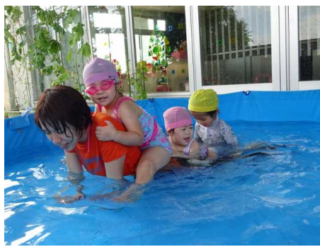
先生の背中に乗って出発！