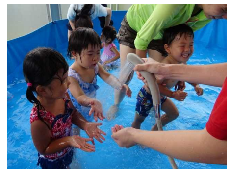
お友達と一緒にシャワー♪