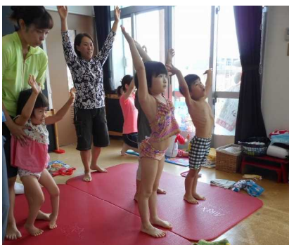
みんなで準備体操！

7月下旬から8月の間は、お天気のいい日はテラスでプール遊びをしました。初めてのプールに怖くて泣く子やゴーグルをつけて水中をスイスイ泳ぐ子、体の力を抜いて浮き輪にもたれて、リラックスする子…。楽しそうな笑顔や頑張る真剣な顔つきに、子どもたちそれぞれの成長が見られました。プール遊びの時には、水着に着替える、服をたたむ、体操をする、自分でシャワーをかける、タオルで体を拭く等、たくさん いけそえもと のことを経験します。ひと夏ごとに、色々な感覚に慣れたり、自分で出来ることが増えていきますね。こうして体をいっぱい動かして蓄えた力が、これから色々なことに挑戦する力にもつながっていきますよ！