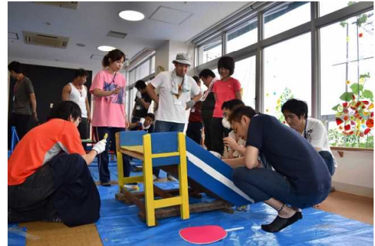
すべり台を分解して色を塗りました

当日ご協力いただいた現役・OBのお父さん方、そして、準備段階から大変お世話になったHパパ、本当にありがとうございました。お父さんたちの思いがたくさん詰まったすべり台とシーソーブランコ、これからも大切に使用させていただきます。