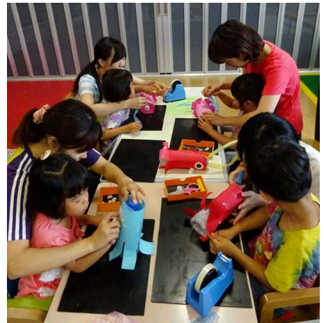
かわいいタコができるかな？

感触遊びでは色水や絵の具、片栗粉などいろいろな遊びを楽しみました。全身を使ってたくさん触ったり、お友だちと色水ジュースごっこをして遊びを広げたり、学童さんは重さを量って片栗粉スライム作りをしたり…各曜日で思いっきり遊びを楽しむ子どもたちの姿が見られました。