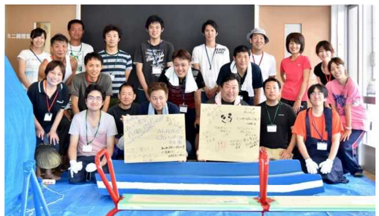
最後は、みんなで記念撮影！