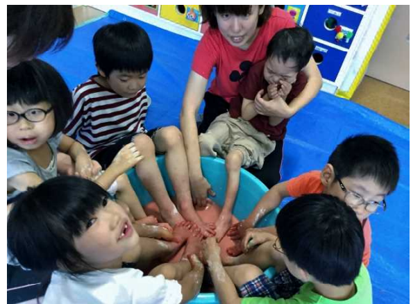
絵の具遊び、楽しいね！