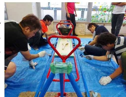
丁寧に塗り分けていくお父さんたち