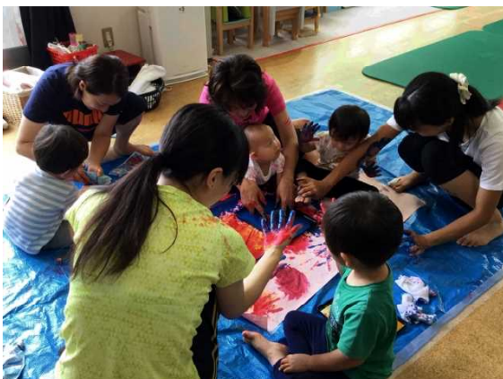
片栗粉スライム、みんなで足で触ったよ！