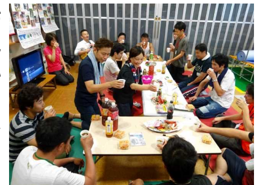
みんなで一緒に交流タイム