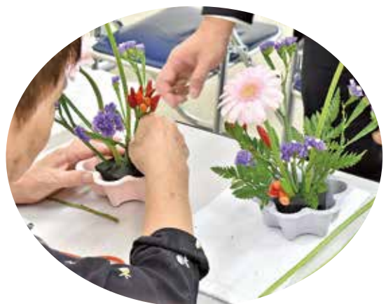
池坊華道会による可愛いお花で生け花体験