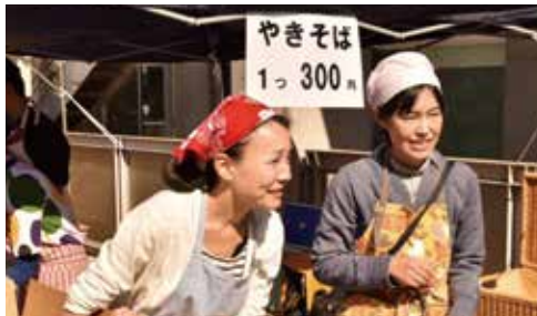
焼きそばを焼くお父さんと売り子のお母さん

秋晴れの中、大盛況だったライトハウスまつりの、あいあい焼きそば屋さん。美味しい焼きそばを焼いてくれたお父さんたち、さすがの手際で、売り子をしてくれたお母さんたちのおかげで、行列が絶えることなく完売しました。遊びに来てくれた子どもたちも「はんど(スタンプラリー)、してきた」や「きそばおいしかった」と楽しそうなお顔。焼きそばを焼くお父さんの姿をじっと見つめる姿が印象的でした。お祭りの楽しい雰囲気の中で、今まで食べられなかった物が食べられたり、館内のいろいろな人と触れ合う機会になったり、お祭りだからこそその経験がたくさんあったと思います。焼きそば屋さんを通して、お父さんやお母さんたちとも和気あいあい、子どもたちやあいあい教室の話をして交流ができました。お手伝い、本当にありがとうございました。