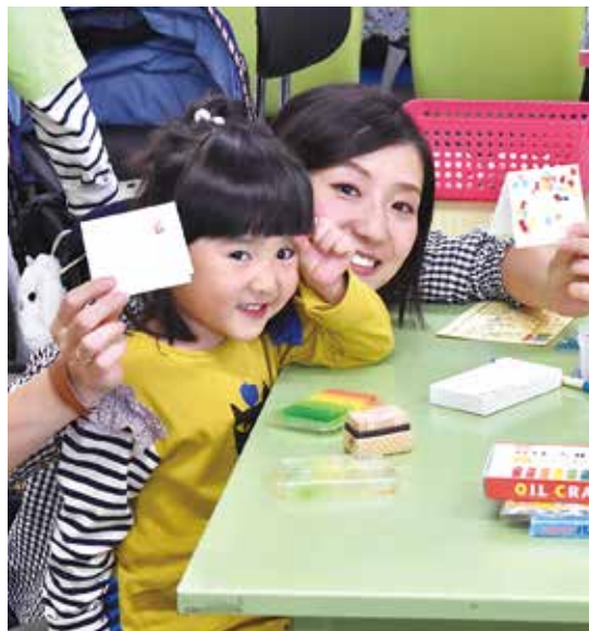
親子でご参加。かわいいカードができました

また、自主製品の販売では、裂き織、紙製品を楽しみましてくださるお客様もおられ、直に声をうかがえる貴重な機会でもあり、作り手の励みになりました。