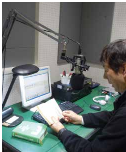
録音スタジオでマイクに向かう音訳ボランティア

ご一報いただければお送ります。一人でも多くの方々のボランティア活動につながれば幸いです。