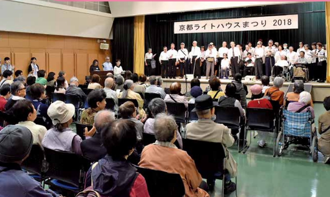
京都ライトハウスまつりでの船岡老人クラブハウスによるステージ発表