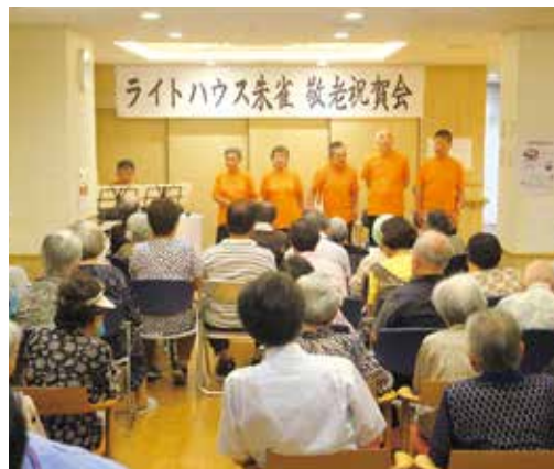
美しい混声合唱に皆さん聴き入っておられました