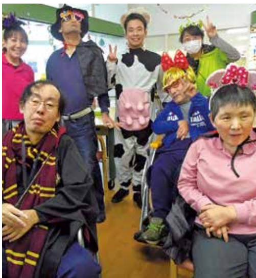
利用者さんと職員と一緒に仮装してパシャリ

利用者さん・職員ともに可愛らしいリボンをつけたり金髪になったり、さまざまな衣装を身に付けて、とても賑やかなプログラムとなりました。