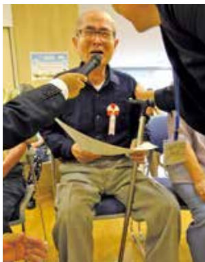
お祝いに泣いて喜ばれるご利用者

今回は平成最後の敬老会。皆さんにとって良い思い出となったのではないのでしょうか。