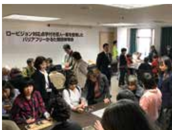
大盛況のかるたイベント