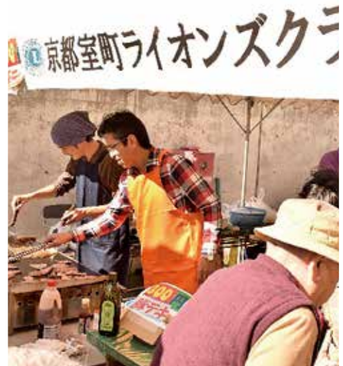
大勢の人で賑わう模擬店