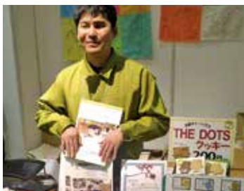
ブースには所狭しと新製品から定番ものまで並べました！

お名前を伺うというも製品を購入してくださる方だとわかってお話が盛り上がり、新たな出会いにも恵まれた有意義な3日間でした。