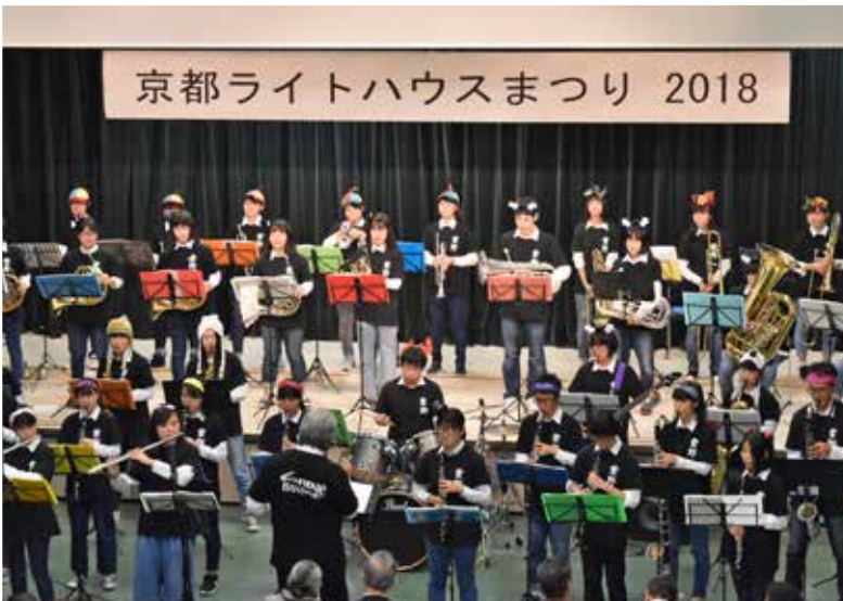
ステージ発表の締めくくり。京都市立紫野高等学校吹奏楽部による熱気あふれる演奏