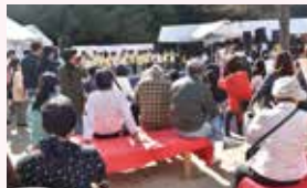
たくさんの地域の皆さまもご来場

野さんに負けじと大声で利用者のMさんも張り切っておられました。新米だったFSTモニーも今では北区の事業所の中にすうーっと溶け込んでいるようです。深まる秋の好日、松や杉の常緑樹と黄色や赤に色づいた木々が交わる船岡山は、たくさんの方々とそのご家族が地域のお年寄りや子どもたちと自然に溶け込む様子と重なっているようでした。