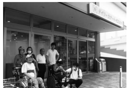
ピカピカの建物です

利用者さんの中には「いつもお世話になっている近所の方々に配ります」と、にこにこ顔でまとめ買いされる方もおられました。