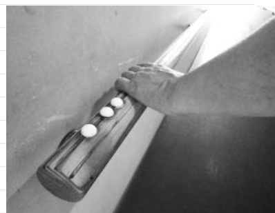
使い込まれ変色した手すり

その一步一步を踏みしめながら、今日もスロープを降りていく利用者さんのいつもの姿がありました。(重 雄次郎)