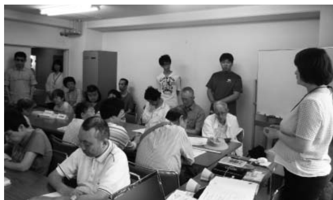
「シネマ・デイジー」に高い関心