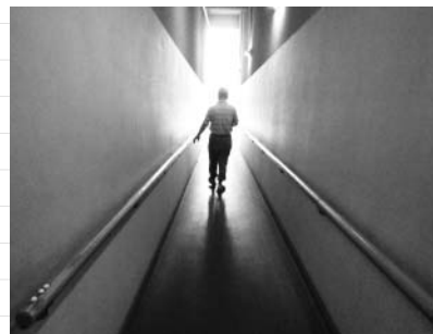
スロープで1階食堂へ