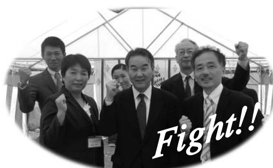
新船岡寮(仮称)開設事務局も一層頑張ってます