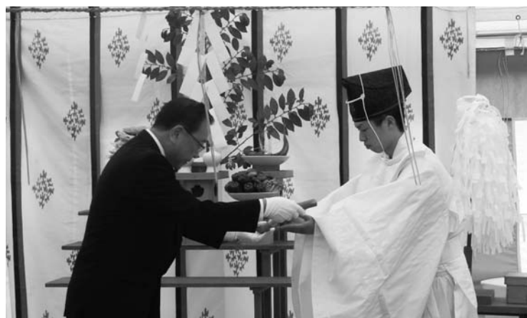
穿初(うがちぞめ)の儀