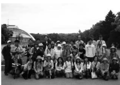
集合写真 植物園入口にて解散前

最後に正面の花壇で記念撮影をおこない、楽しい植物園散策を終えました。(青木 一憲)