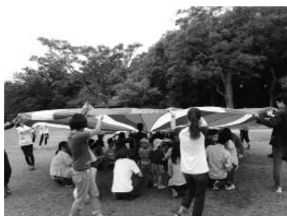
みんなでパラバルーン

心地よい風に、子どもたちの笑顔と歓声があふれていました。お弁当を食べてからは、ほっこり