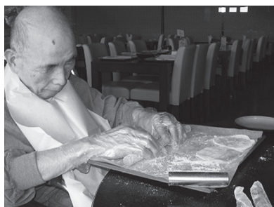
生地を伸ばしています

そして京都駅ビル内にあるホテルグランヴィア京都にて昼食。それぞれが好きな素材を天ぷらにしてもらい、舌鼓を打ちました。