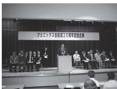
20 周年記念式典ご来賓の方々

をいただくことができました。これからも会員相互の親睦や後輩の支援などを通じて鳥居寮の訓練事業にご支援をお願いいたします。