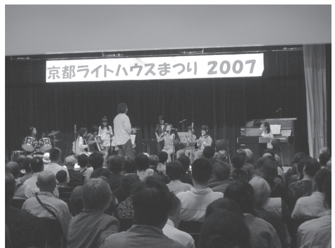
鷹峯小学校合奏部の演奏