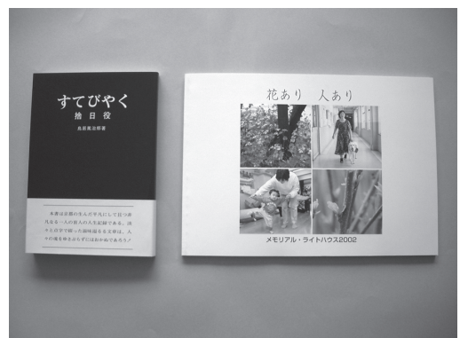
「すてびやく」と「花あり人あり」

用具コーナーには、この他、鳥居寮の修了生のエッセイ、ライトハウス写真集「花あり人あり」、点訳の参考書なども置いています。冬の夜長、温かなこたつに入りながらゆっくりと読書にいそしみ、ライトハウスの歴史に思いをはせてみるのはいかがでしょうか。