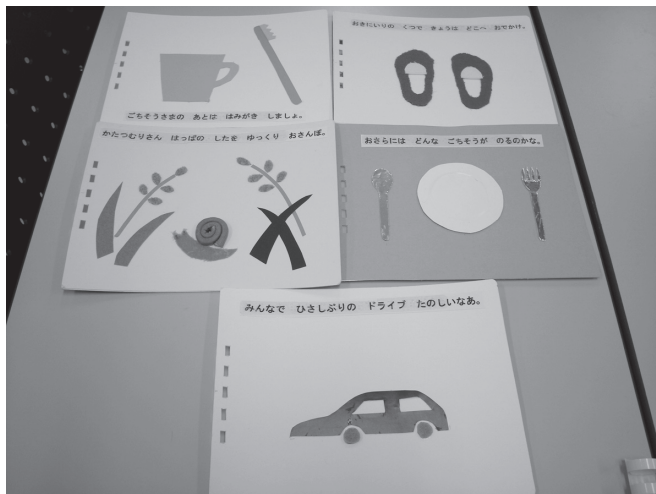
完成した5ページのミニ絵本