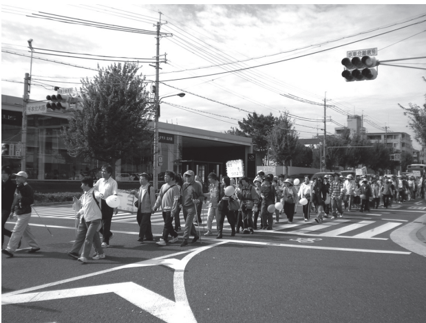
秋空の下、白杖と風船を持って歩く

安心して歩ける安全な道の実現に向け、会員の皆さまのさらなる団結とご支援を心からお願い申し上げます。