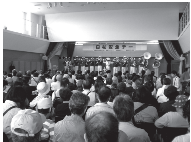
ホールいっぱいの参加者と吹奏楽団の演奏