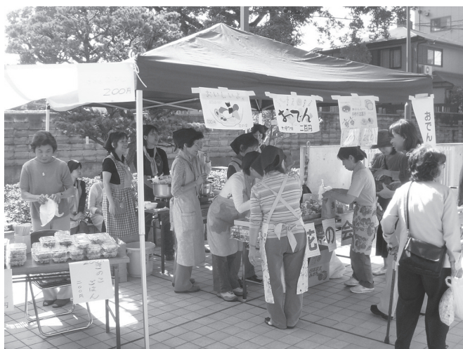
にぎやかな模擬店の風景

京都ライトハウスまつりは地域・利用者・ボランティアの皆様を支えられ3回目を迎えることができました。本当にありがとうございました。