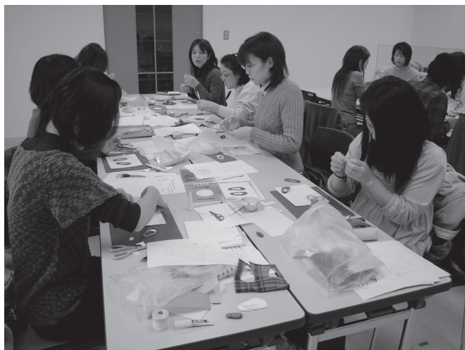
おしゃべりを楽しみながら、手先を器用に動かすお母さんたち

当日お母さん方は、小学生に戻ったかのようにおしゃべりに花を咲かせながら、楽しそうに手を動かし、そして懸命に取り組んでおられました。2時間という短い時間で完成させなければいけなかったのも、後半はおしゃべりも止まり真剣な表情で時間と戦いながらの作業でした。靴・コップ・カタツムリなどが触れるように貼り付けられ、何とかA5版