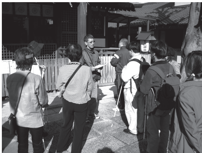
古都京都の歴史を味わう訓練生の皆さん～玄武神社の前にて～

今回ご紹介するのは、10月に実施した「古都散策・西陣路地裏探検隊」です。参加希望者が40人を超えたため2回に分けて実施しました。まず市バスで北大路堀川まで行き、